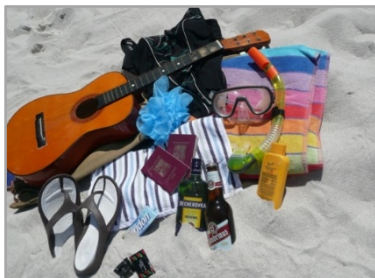
Obr. 2 - fotografie k filmovému plakátu

Druhý projektový kurz prezentoval film Kawasakiho růže , 11 který byl vybrán lektorkou kurzu, otitulkován během letního semestru 2013 a zařazen do programu řezenského kina Andreasstadel na rok 2013/14 v rámci řady českých filmů nazvané Pozvánka do kina – Tschechische Filmreihe im Andreasstadel .