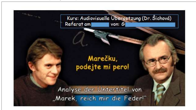
Obr. 8– Ukázka z referátu – nevyhovující překlad názvu filmu Marečku, podejte mi pero .

V kurzech audiovizuálního překladu můžeme toto téma diskutovat na stávajících překladech, přičemž je důležité upozornit studenty na eventuální aluze a jiné souvislosti, které s sebou jak originál, tak překlad nese. 40 Osvědčila se diskuze nesprávných překladů, kterých bohužel v případech překladů do němčiny existuje velké množství (viz extrémně špatně přeložený název komedie Marečku, podejte mi pero , k tomu srov. i diskuzi na internetu).