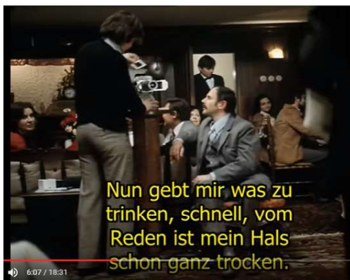
Obr. 3 – Ukázka z referátu – prezentace nesprávně naformátovaných titulků

Dalším důležitým bodem je členění dlouhého titulku (jeden titulek by měla většinou tvořit jedna věta/promluva; výjimky zde ponechme stranou), tedy rozdělení do zmíněných dvou řádků. Platí pravidlo, že předěl by měl být na co nejvyšší syntaktické úrovni.