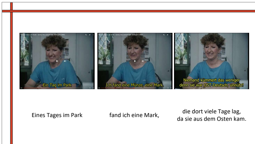
Obr. 7- Ukázka z referátu (analýza titulků k básničce z filmu Slunce, seno a pár facek )

V neposlední řadě se musí překladatelé rozhodnout i pro adekvátní název filmu. O jeho důležitosti v cílovém jazyce svědčí i fakt, že právě název díla bývá často to první (a možná jediné), s čím se recipienti – čtenáři, diváci, posluchači setkávají a co je eventuálně motivuje k tomu, aby se o dílo dále zajímali. 37