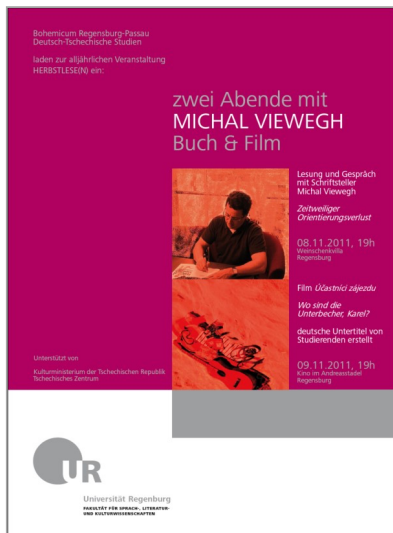
Obr. 1 - plakát k akci Herbstlese(n) 2011